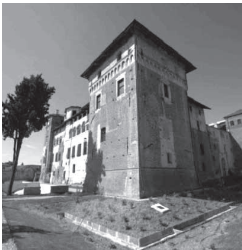
◀ Castello di Lagnasco (Cn)