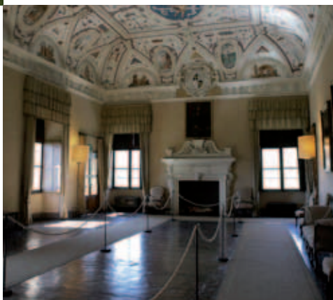
FAI - Fondo Ambiente Italiano Castello della Manta (CN) Sala delle Grottesche ▶ XVI secolo