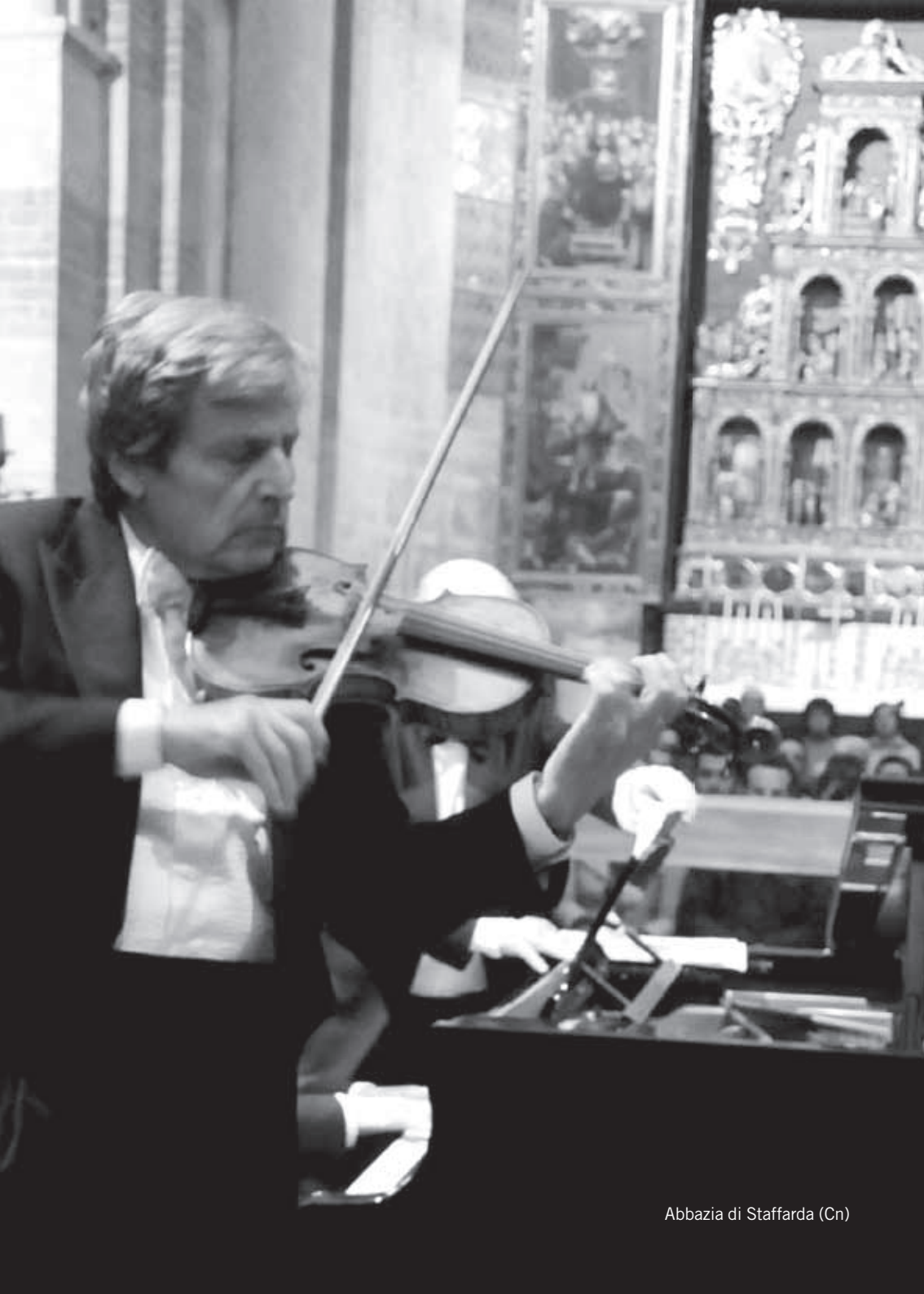
Abbazia di Staffarda (Cn)