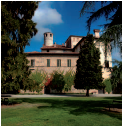
◀ FAI - Fondo Ambiente Italiano Castello della Manta (CN) XIII-XVI secolo